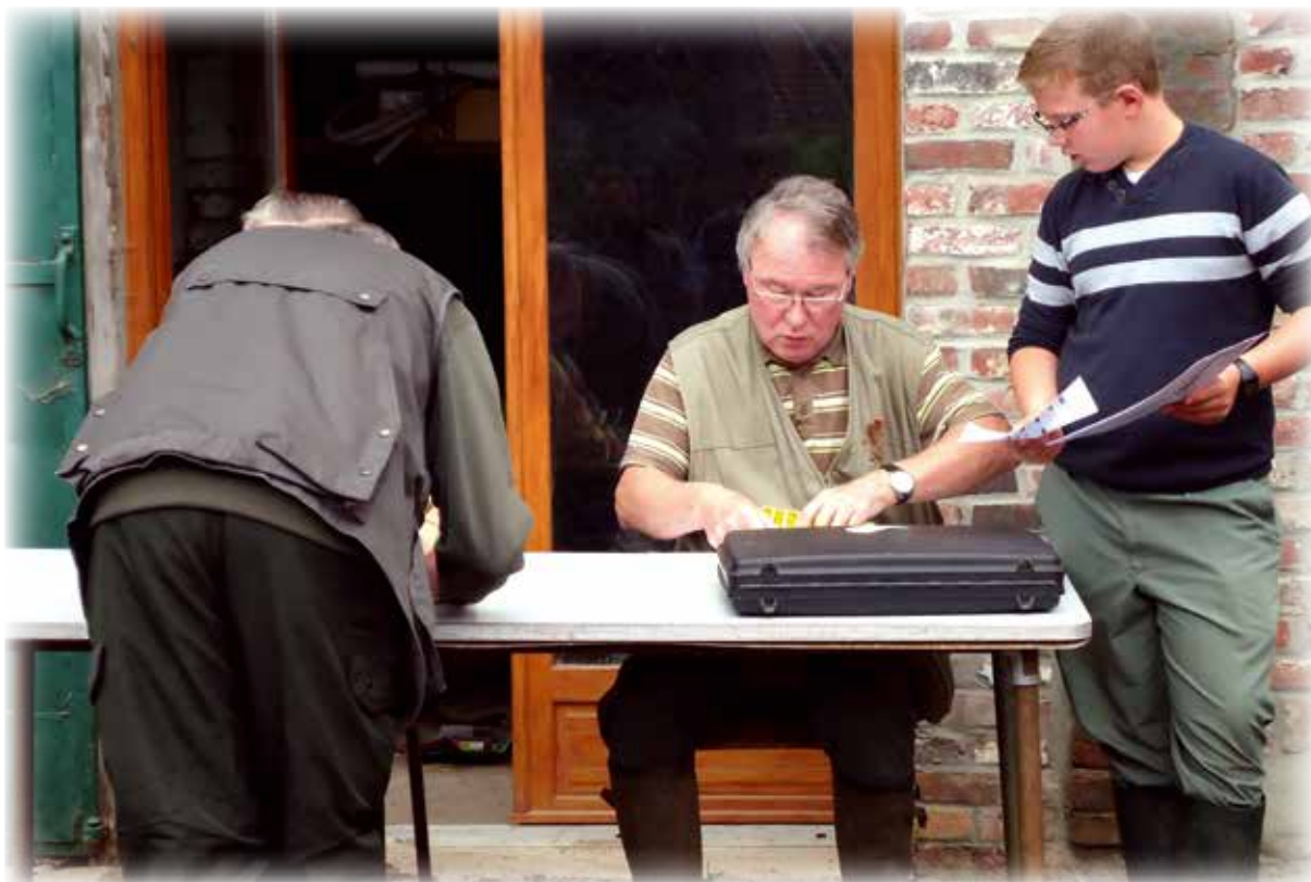
Contrôle des permis et remise de bagues

La Société de Chasse d'Estrées présente à tous les Estrésiennes et Estrésiens ses meilleurs vœux pour 2015