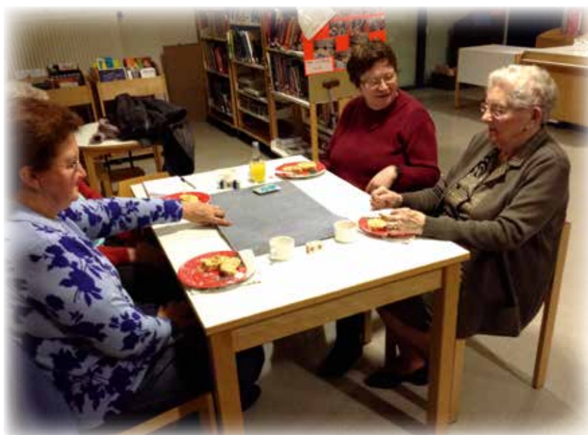
Dégustation de la bûche de Noël