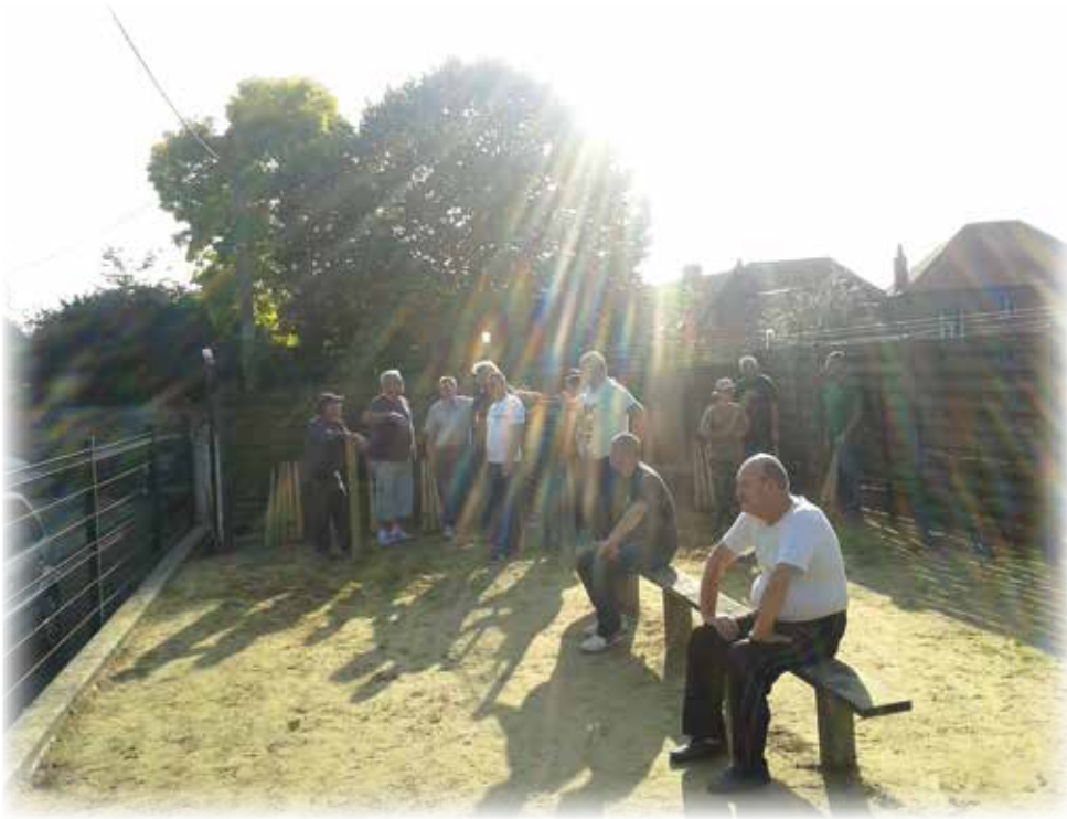
Tournoi lors de la Ducasse de Septembre