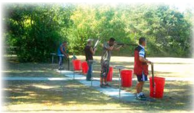
Le ball-trap du mois d'août