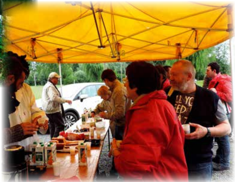
Les animateurs participent aux enquêtes à BRUNEMONT, mai 2014