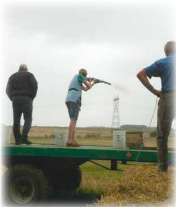
Le tir à la perdrix