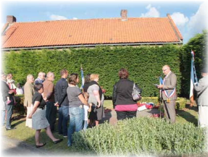
Commémoration de l'appel du 18 juin 1940 au square Maurice Sauvage