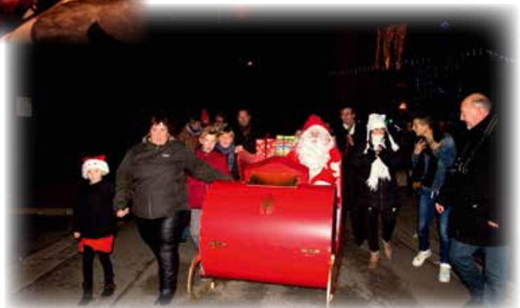
L'arrivée du Père-Noël en traîneau