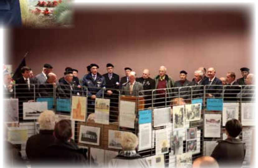
Exposition réalisée par J. Tadyszak « 14-18 : Estrées dans la Tourmente » avec les Anciens Combattants