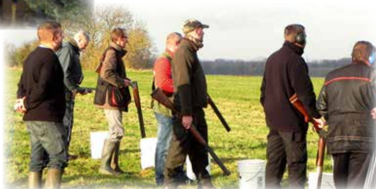
Ball-trap avec l'amicale des Tireurs de la Sensée