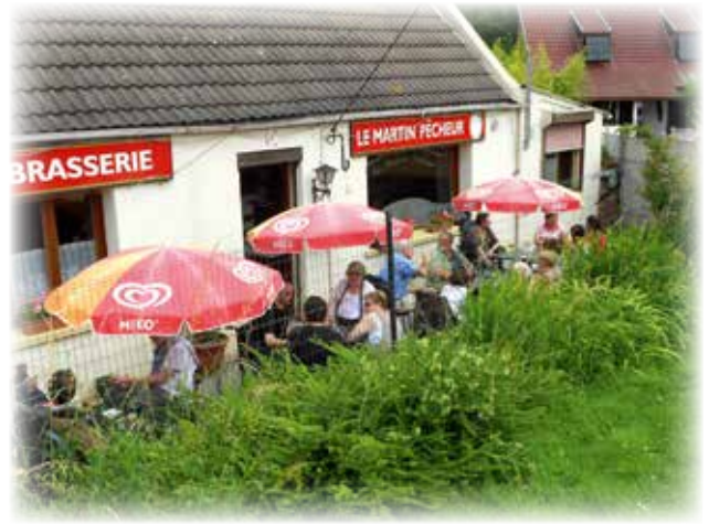
Déjeuner au Martin Pêcheur