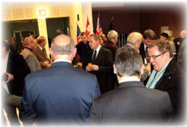
Une partie des visiteurs de l'EXPO.