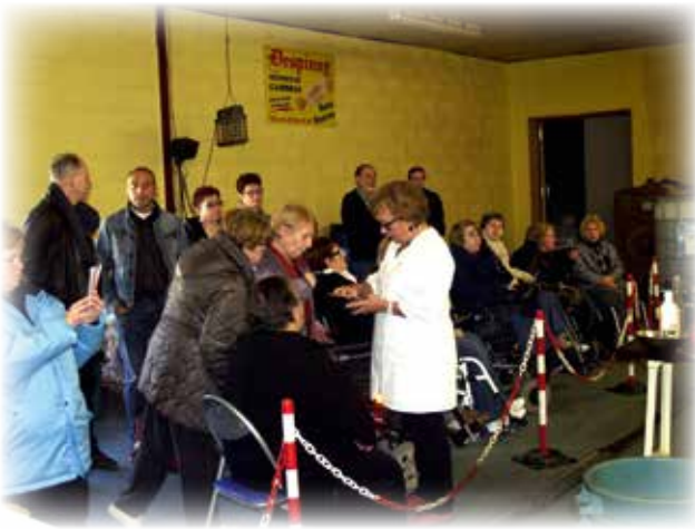
Visite des bêtises de Cambrai