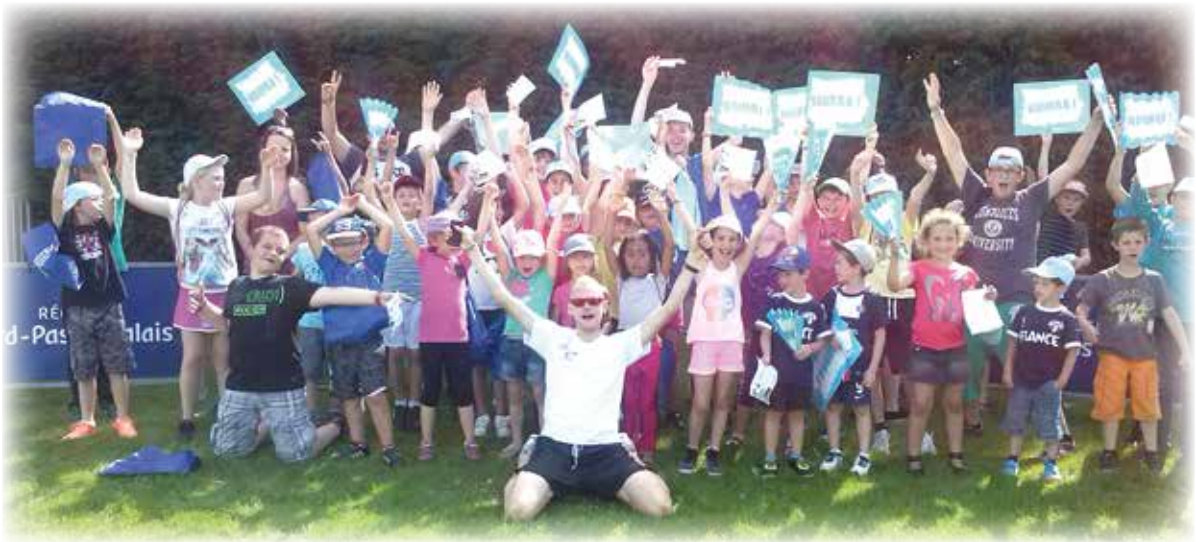
Journée athlétisme au stade, remise des diplômes