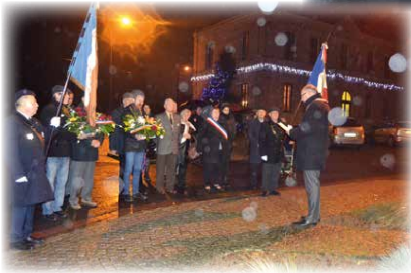
Cérémonie du 5 décembre en hommage aux anciens combattants de la guerre d'Algérie et des combats du Maroc et de la Tunisie