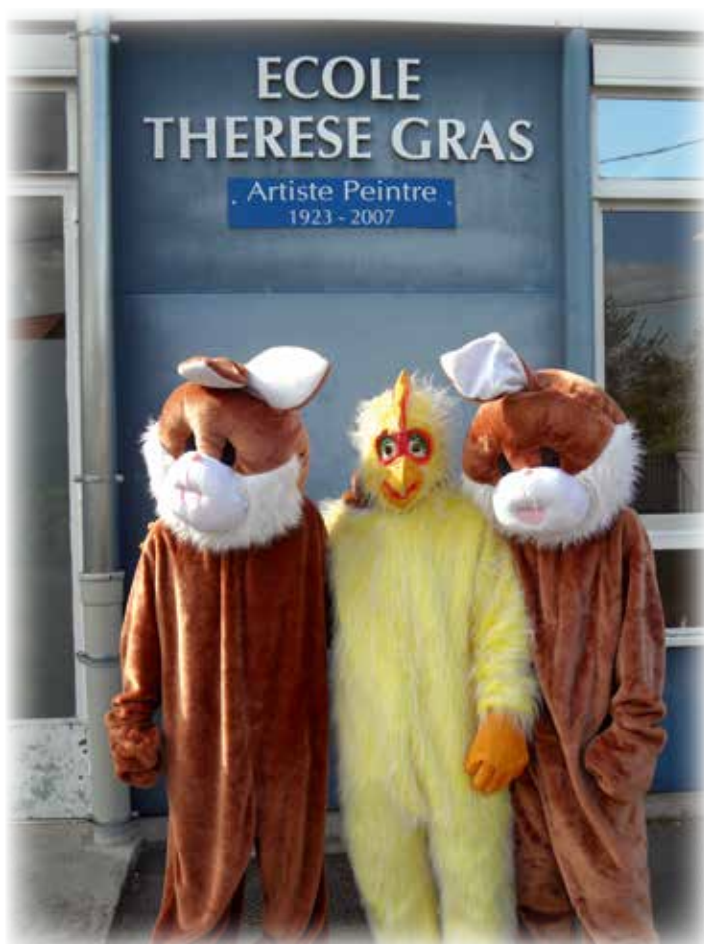
Distribution de chocolats de Pâques