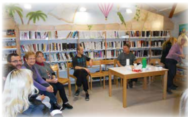
Un petit café pour se réchauffer