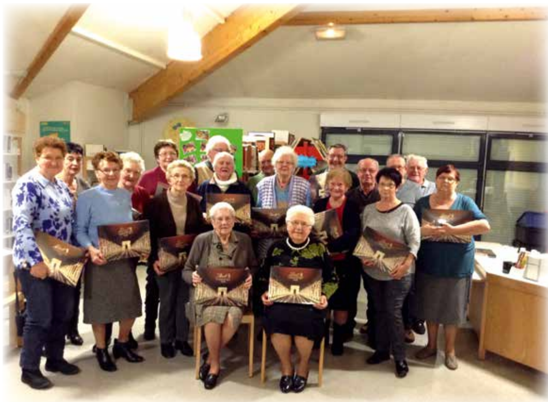
Remise des chocolats