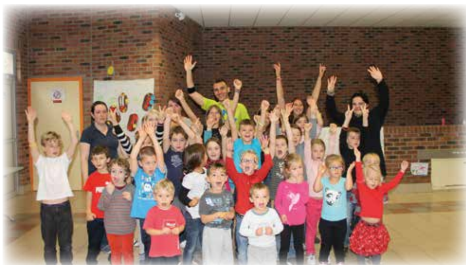
Initiation à la Zumba®