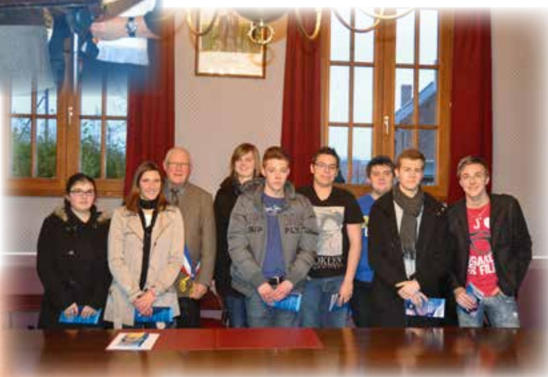
Cérémonie de citoyenneté : Les jeunes du village reçoivent leur 1 ère carte d'électeur