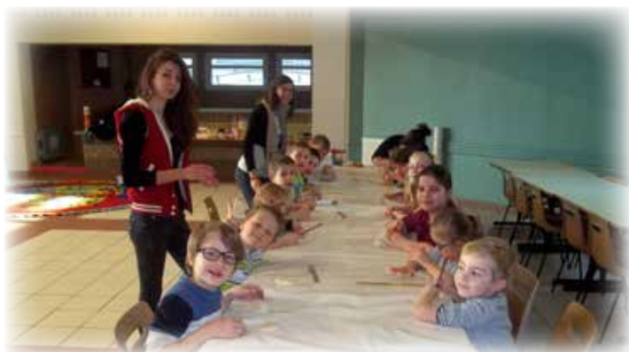
Activité pâte à sel