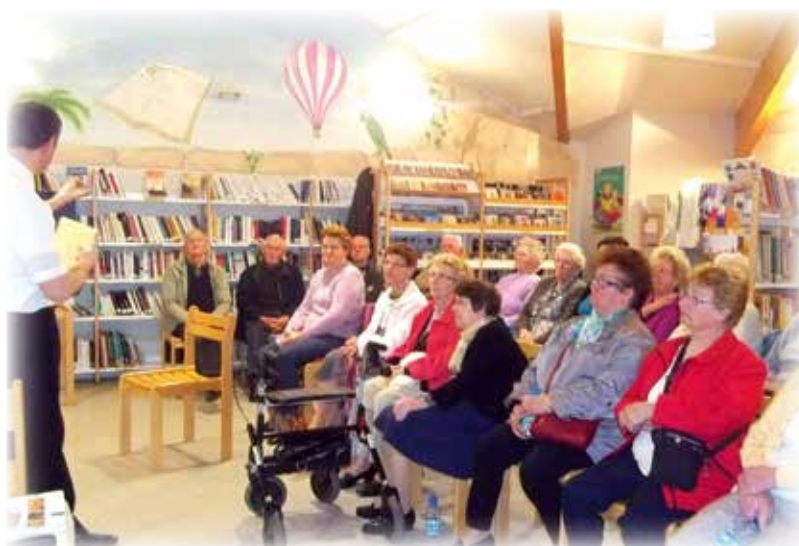
Repas démonstration du 28 mars 2014