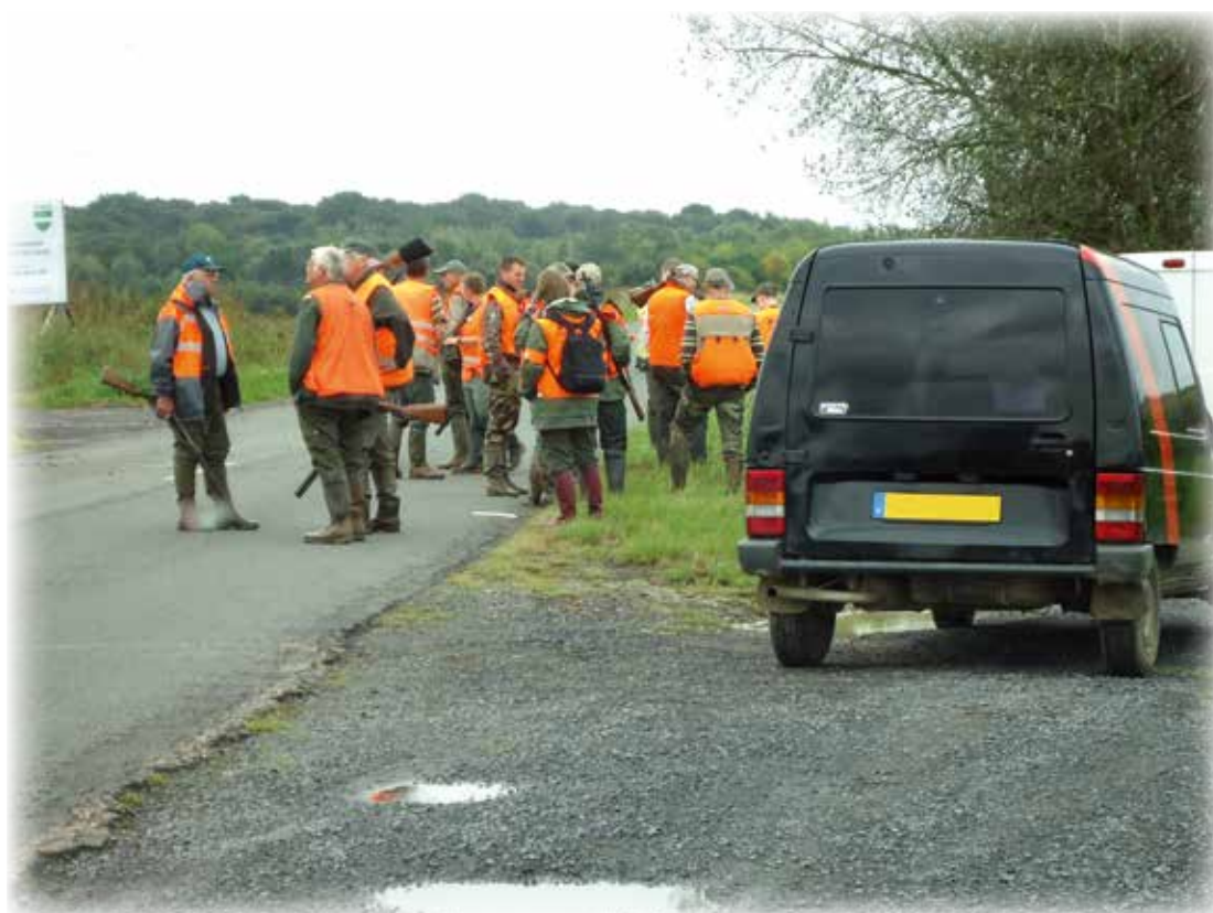
Sécurité : port du gilet pour tous