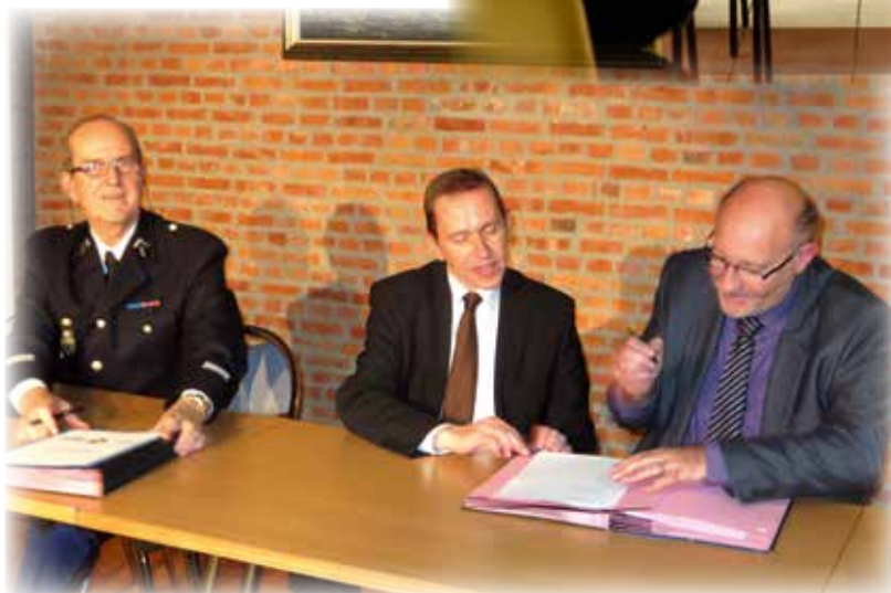
Signature de la convention « Voisins vigilants » avec M. le Sous-Préfet.