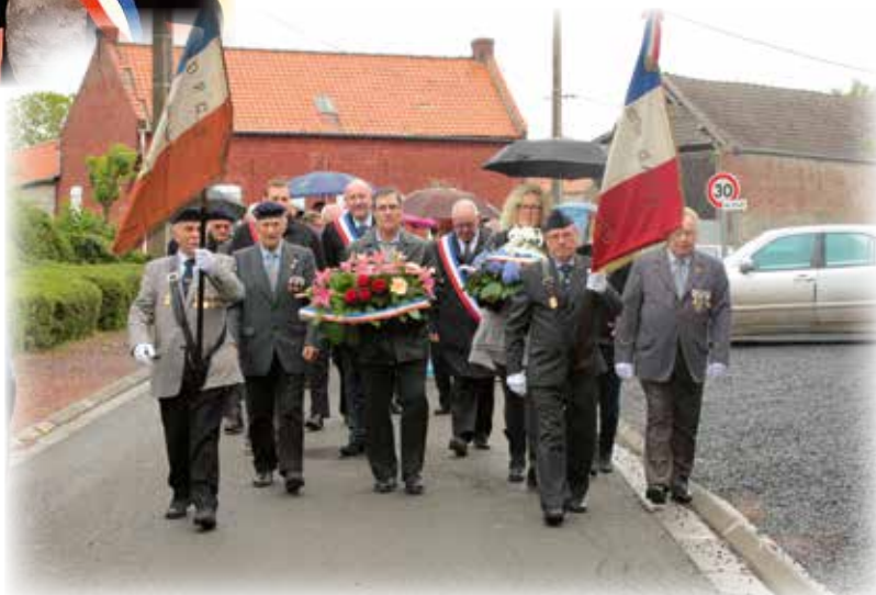
Cérémonie du 8 mai 1945