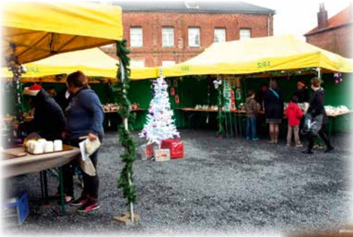
Le marché de Noël organisé par l'APE