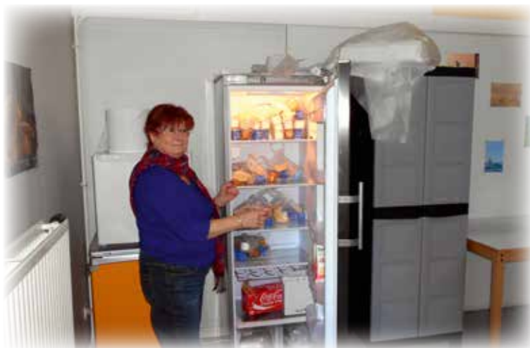
Le réfrigérateur est plein