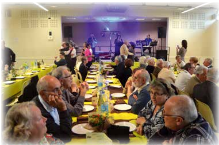
L'après-midi animée par l'orchestre Nadège et ses musiciens

Le repas des aînés a eu lieu en octobre dernier. Plus de 80 personnes ont répondu à l'invitation de la Municipalité.