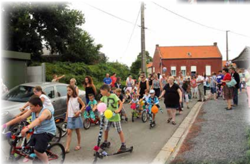
Les vélos fleuris des enfants du centre de loisirs