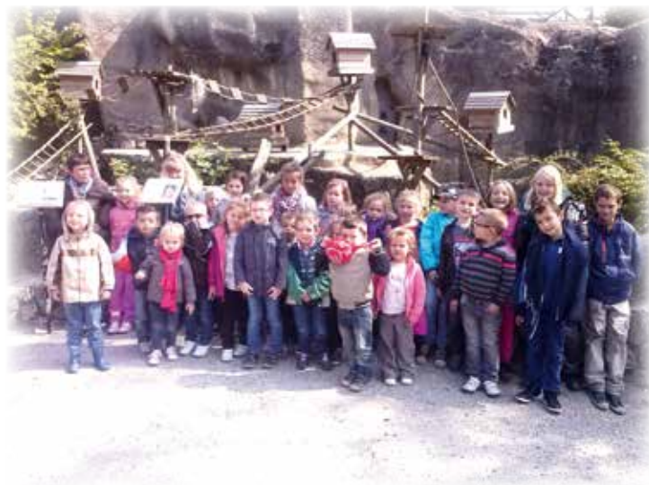
Visite du zoo de Maubeuge

Ils sont également allés à la piscine de Liévin, au parc « les prés du Hem », à Hamel pour un inter-centres avec les enfants de l'accueil de loisirs d'Hamel, dans les marais avec MNLE pour la création d'un tableau nature, puis au zoo de Maubeuge. Des activités manuelles et sportives avec les animateurs ont complété le programme.