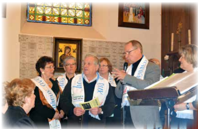
Concert « Noël heureux avec eux » à l'église d'Estrées avec le SIRA courant janvier