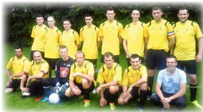
Les séniors B