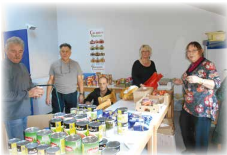
Tout est prêt, on peut démarrer