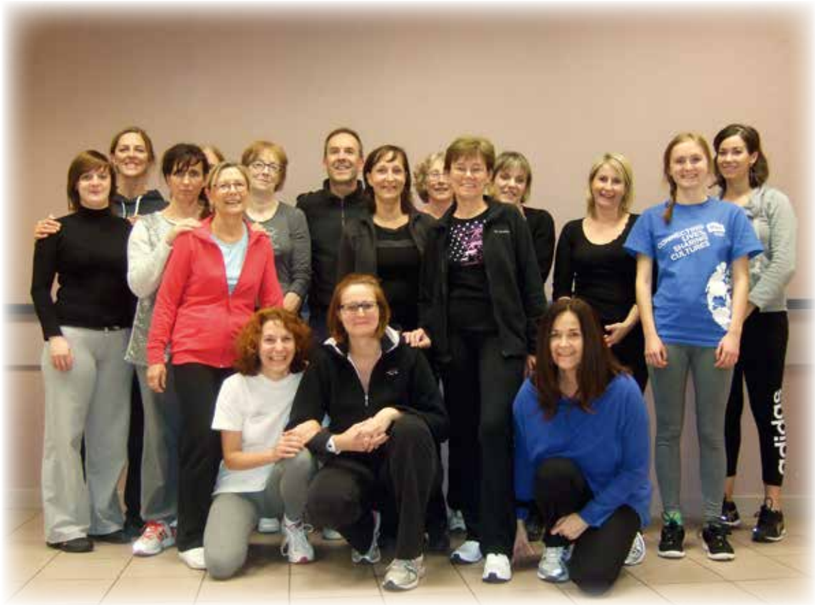
Cours de gym