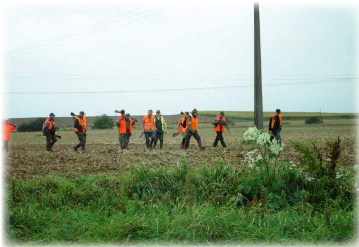
Fin de traque fusil en sécurité