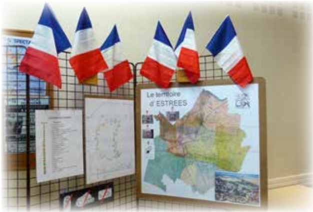
Présentation de l'exposition : "ESTREES dans la Tourmente" 1914-1918.