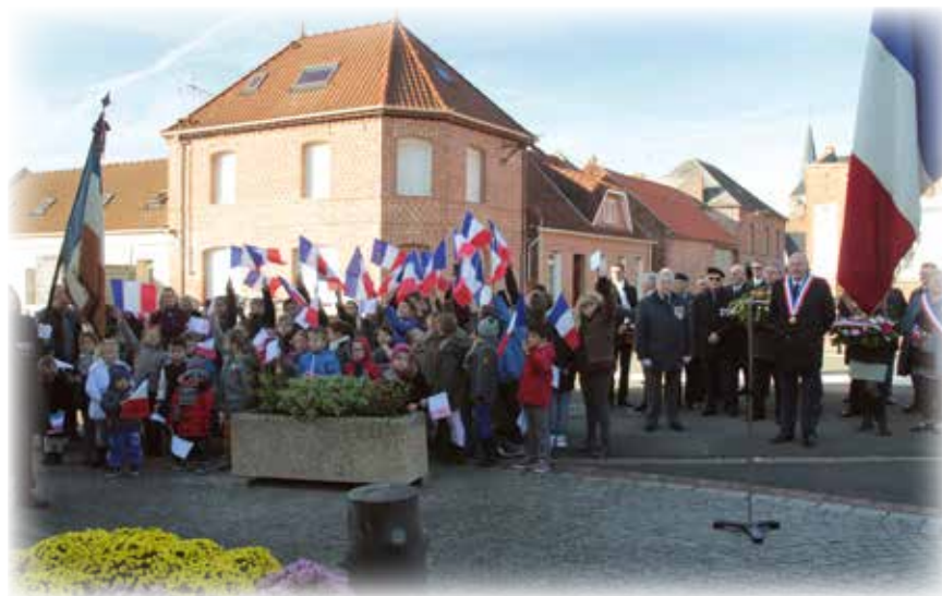
11 Novembre : les nombreux enfants accompagnés des parents avant le début de la cérémonie.