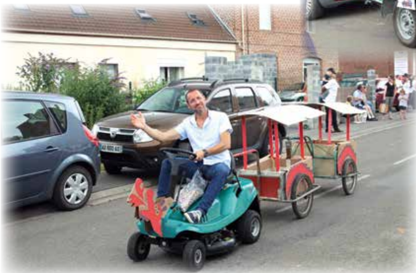
Le petit train