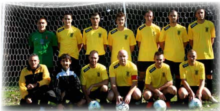
Les séniors FFF