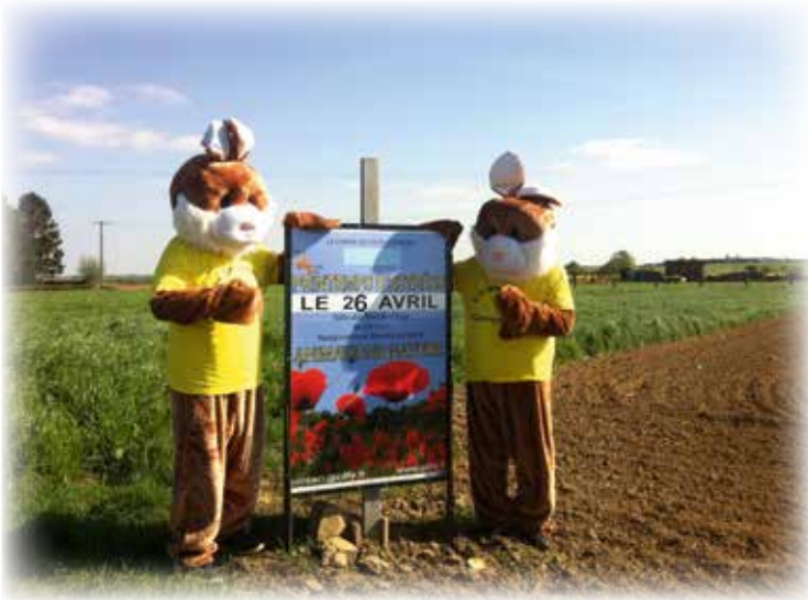
Le printemps d'Estrées