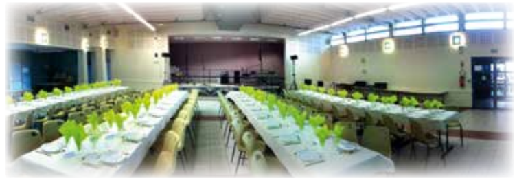
Repas lors de la Ducasse de juillet