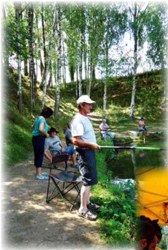
Journée récréative à l'étang de pêche de TORTEQUESNE, août 2014