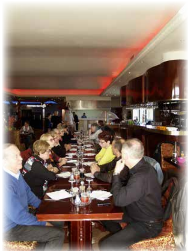
Déjeuner à Proville