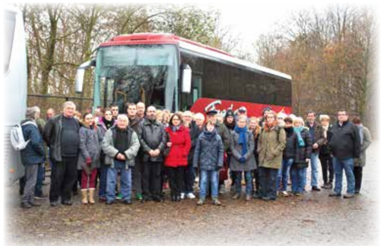
Voyage au marché de Noël de Maastricht