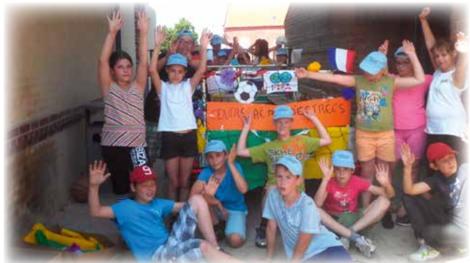
Décoration du char à confettis pour le défilé du Mont Carmel