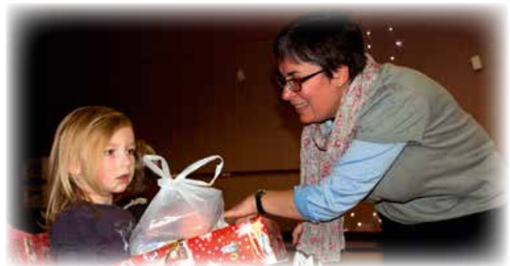
Distribution de cadeaux par l'APE et de friandises par la Municipalité