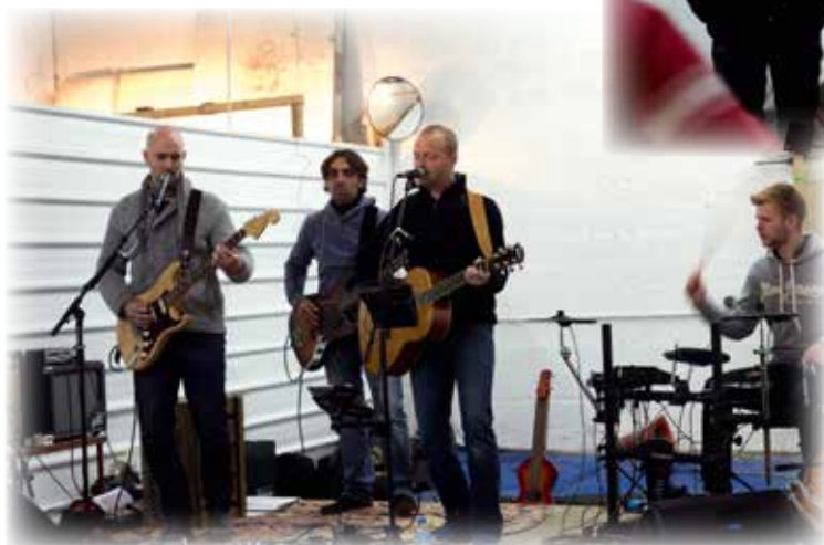
Concert des groupes Mayreed et Delom