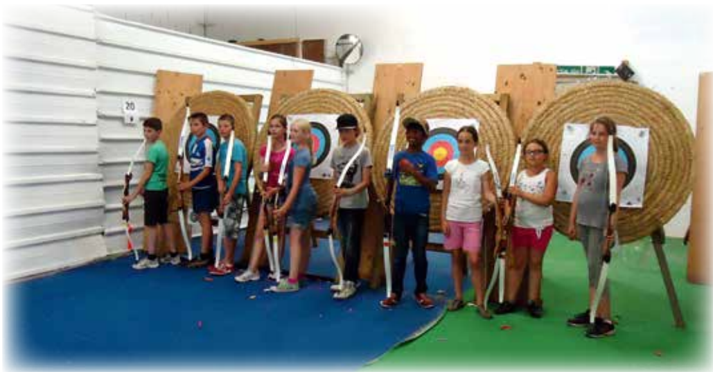
Juillet 2014, accueil annuel du CLSH d'ESTREES, en attendant la remise de médaille