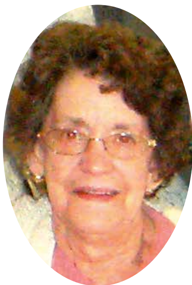
Une petite pensée particulière de tous les membres du club pour Josiane