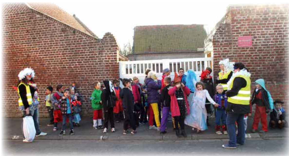
Défilé pour Halloween

Nous espérons que vos enfants ont passé d'agréables moments durant cette année 2014 et nous leur donnons rendez-vous pour les vacances de 2015, soit 2 semaines en février, 2 semaines en avril, 4 semaines en juillet et 2 semaines en octobre.