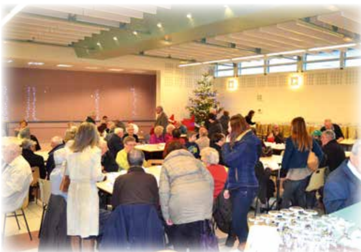
Le goûter, un moment d'échange entre nos aînés