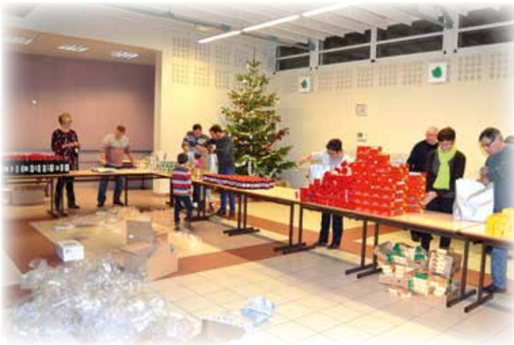
Préparation des colis par la Municipalité

Fin décembre, les aînés ont reçu un colis lors d'un goûter organisé à la salle André Cauchy