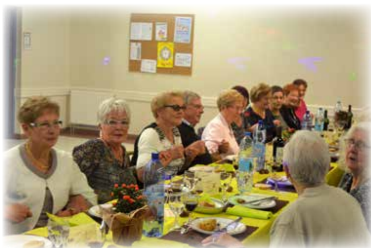
Ambiance assurée au cours du repas