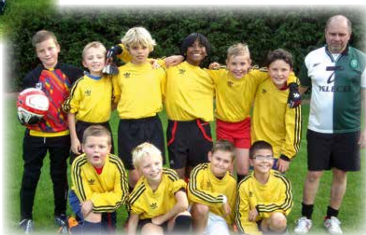
L'équipe U 11