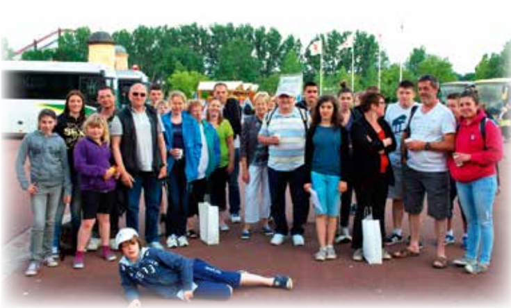
Voyage à Walibi