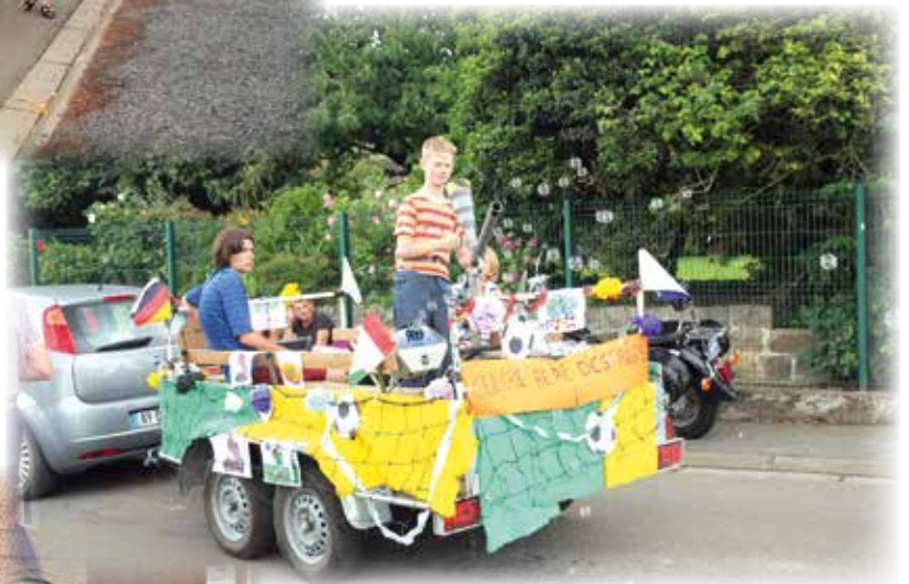
Le char à confettis