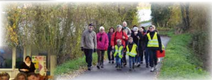
Marche vers Férin afin de retrouver les marcheurs de Lambres les Douai