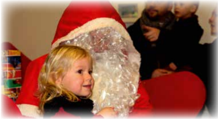
Pour le plaisir des tout-petits