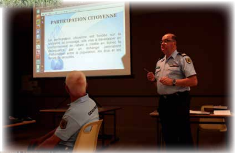
Participation citoyenne : Mise en place de l'opération « Voisins vigilants » en juin