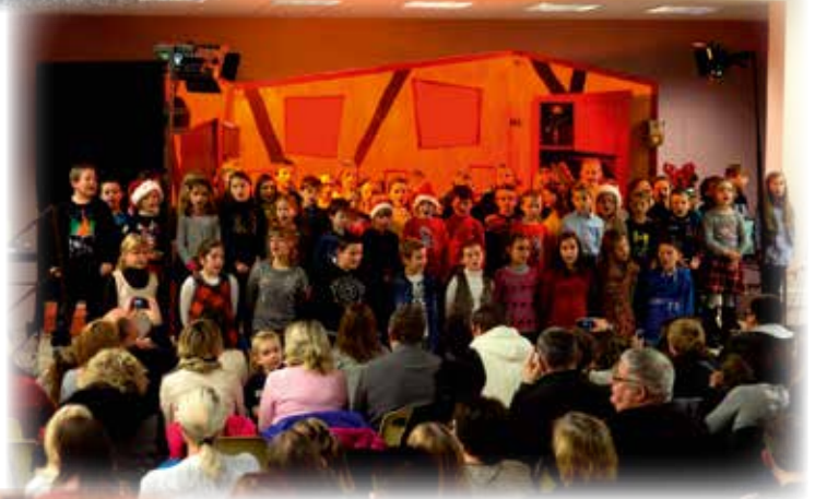
Les enfants chantent Noël