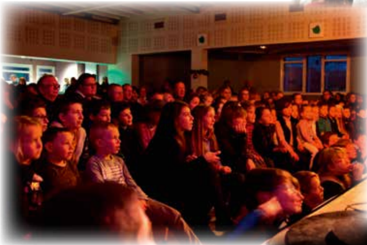
Le spectacle offert par l'APE fut très apprécié des enfants