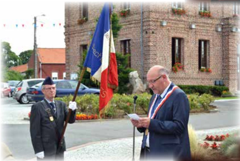
Cérémonie du 14 juillet au monument aux morts