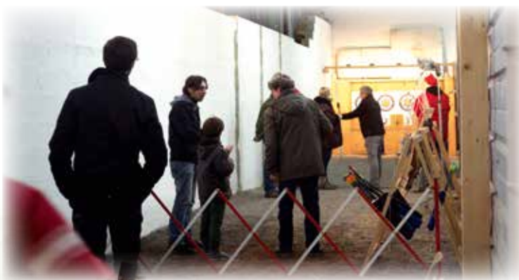
Initiation au tir à l'arc avec le collectif 1026

Cette année, le téléthon a eu lieu le week-end du 6 et 7 décembre. Plusieurs associations ainsi que la Municipalité se sont mobilisées. Tous se sont réunis au local du collectif 1026. L'APE avait mis en place une buvette avec chocolat chaud pour réchauffer les courageux qui avaient bravé le froid. Les « Tempes Argentées » et la « Butte Estrésienne » ont effectué un don pour cette cause. Ce sont 1200 € qui ont été récoltés et reversés à l'AFM Téléthon. Un grand merci à tous les bénévoles et aux généreux donateurs.