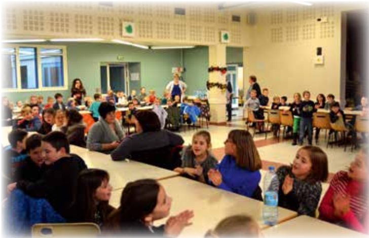
Le repas de Noël offert à tous les enfants de l'école par la Municipalité