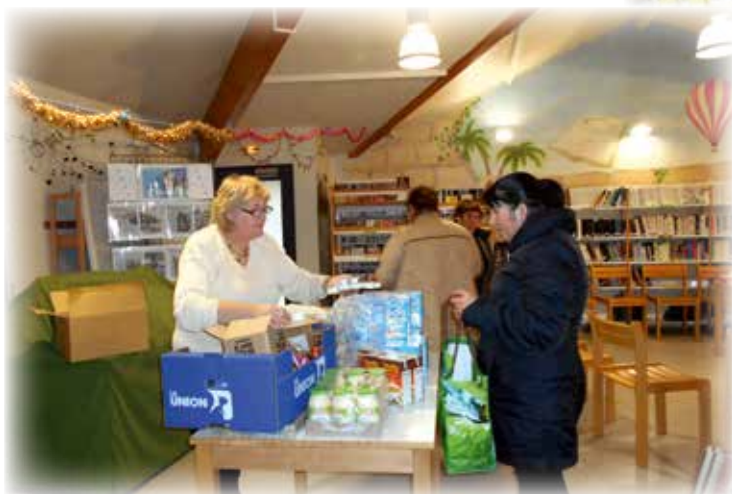
Signature en fin de passage